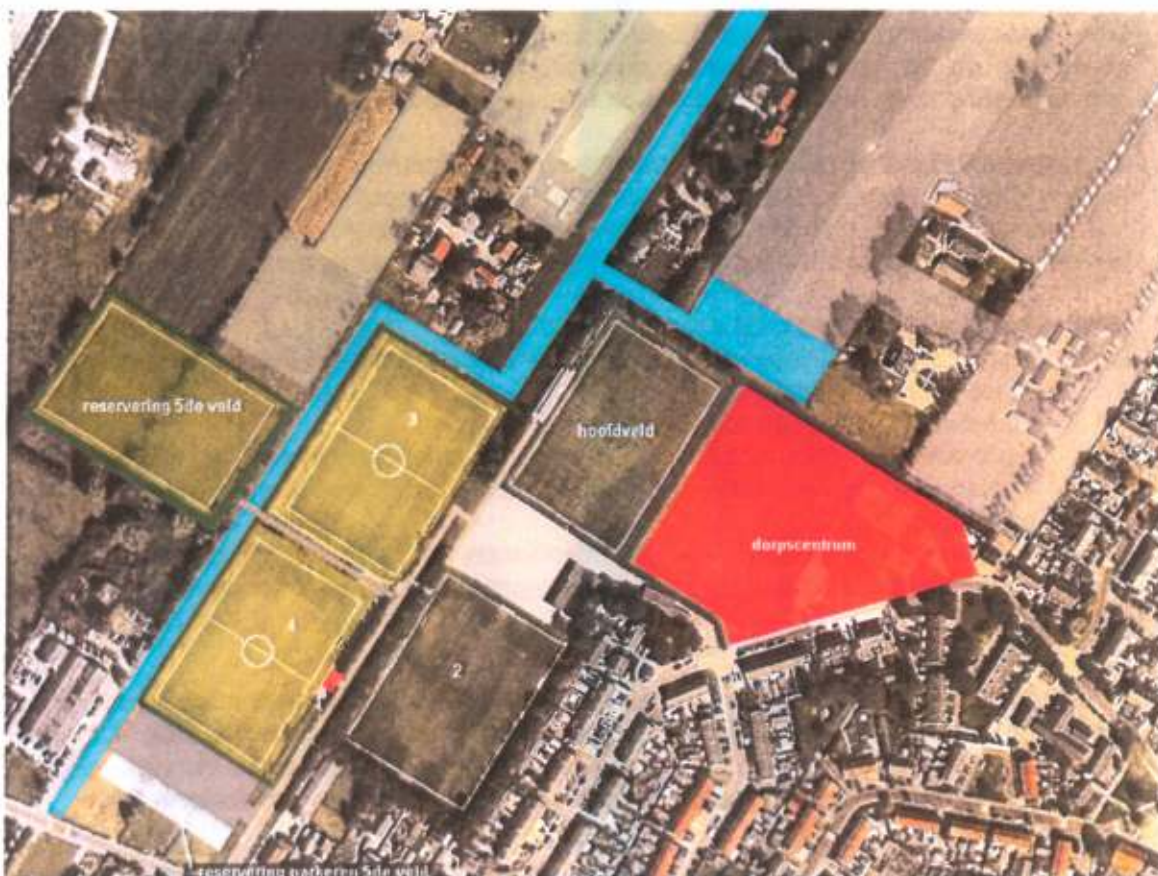
Figuur: inpassen Veensche Boys

De gemeenteraad heeft op 15 maart 2007 de uitgangspunten vastgesteld voor de ontwikkeling van Nijkerkerveen. Een van de uitgangspunten was dat Veensche Boys verplaatst moet worden om het dorp af te kunnen ronden. Bij deze heroverweging is onderzocht of het inpassen van Veensche Boys in financieel opzicht positiever is dan het verplaatsen naar de locatie nabij Starlight. Voor de inpassing is een aantal varianten uitgewerkt en besproken met het bestuur van Veensche Boys. Partijen waren beide meest positief over onderstaande variant.